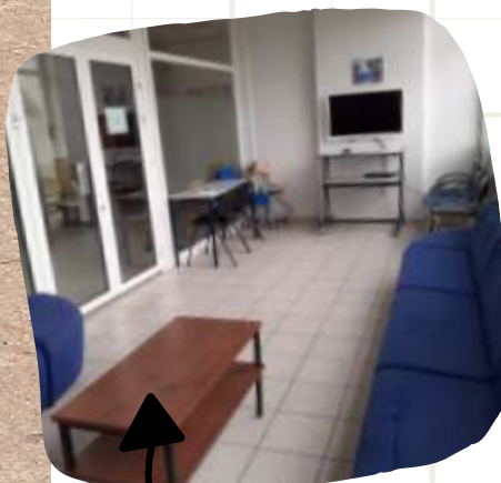
Salle de détente