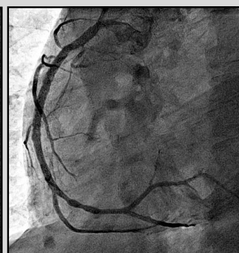
Résultat après angioplastie à la phase aiguë d'infarctus.