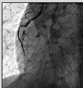
Occlusion coronaire droite.

La cardiologie interventionnelle (angioplastie coronaire) a, elle aussi, bénéficié de ce développement avec l'utilisation à grande échelle des prothèses